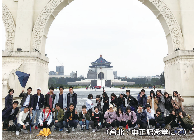
(台北：中正記念堂にて)

ご飯も美味しく、人も優しく、観光する場所も多く、台湾はとてもいい国でした。またいつか、自分でも行ってみたいと思います。