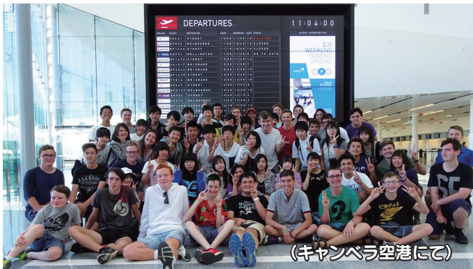
(キャンベラ空港にて)

別れの時はつらく、泣いている生徒もいました。観光では買い物をしたり、海に行ったりして楽しみました。私たちはこの語学研修を通して、多くのことを学ぶことができました。