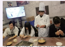
ギョーザ作り体験 (華東師範大学)

私が上海に行って楽しかったことは、初めて見た上海雑技です。プロの人たちが棒の上で大ジャンプをしたり、シーソーの上で人を飛ばしたりするのはとても面白かったです。他にもプランコギマジック、四回しなど、たくさんの人たちがバフオマンズを披露しました。とても感動しました。