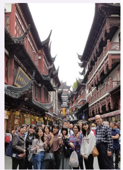
豫園(よえん)での買い物