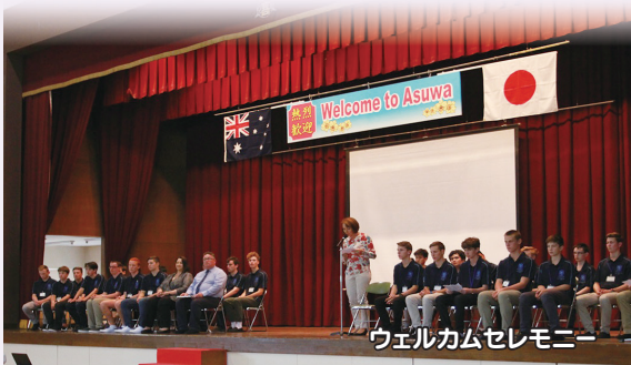
ウェルカムセレモニー

マリスト高生二人ホストを、たった一週間でしたが、とても多くのものを得ました。それは、英語力、思い出し、家族が二人増えたことです。二人がオーストラリアに帰国後も、毎日連絡を取り合っています。この経験は私にとって、貴重で一生の思い出になりました。