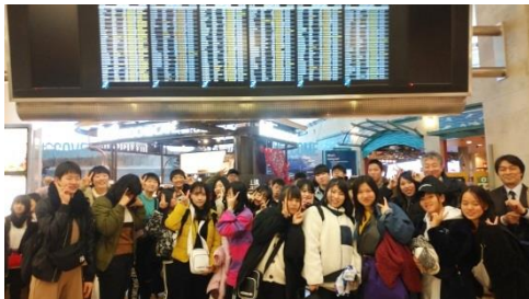
全員無事に保安検査を通過