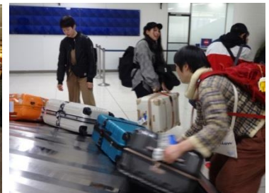
協力してスーツケースを 引き取りました。

シアトルからロスへのフライトは約2時間。ロス空港に到着後、バス移動で昼食会場となるショッピングモールのレストランへ。ビュッフェスタイルで各々好きな料理を楽しみました。