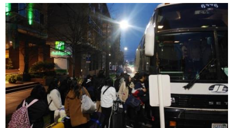
ロ 早朝の搭乗手続き

今朝はシアトルからロサンゼルスへの移動から始まりました。早朝6時半から朝食をとり、すぐに出発。20分ほどのバス移動でシアトル・タコマ空港に到着しました。この日はアメリカでは祝日の「President's Day(大統領の日)」。初代大統領ワシントンの誕生日だそうです。その影響もあってか、タコマ空港は大混雑。搭乗手続きをした後、手荷物検査・保安検査を待つ人の列は、グネグネと数百メートルほどに及んでいました。搭乗に間に合わないのではと心配していた矢先、航空会社の係の方が我々をサッとエスコートし、優先的に検査ゲートのところまで案内してくれました。そのおかげで時間に余裕をもって搭乗することができました。