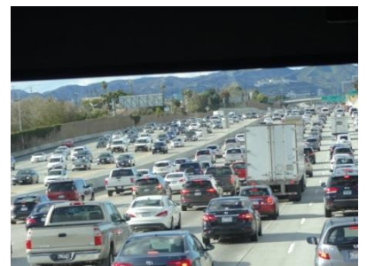
片側5車線のフリーウェイが車で埋め尽くされていました。