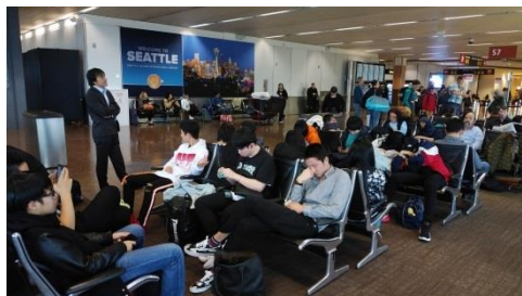
早朝からの移動でお疲れモード